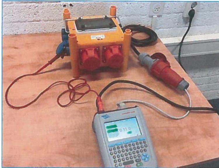
De meetopstelling met een zwerfkast.

Deze test zal een sinusvormige lekstroom stroom van 30 of 15mA laten lopen tussen de fase en de aarde van het netsnoer en meet de tijd, die nodig is voor aardlekschakelaar om uit te schakelen.